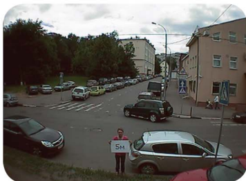
3.6 (78°) мм