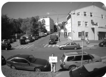
3.6 (78°) мм