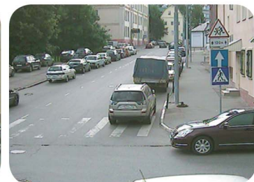
9.5 (29°) мм