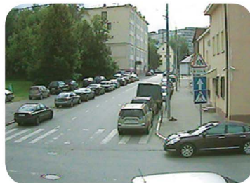
3.8 (65°) мм